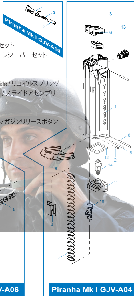
Piranha Mk I GJV-A04