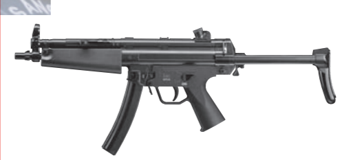
MP5 Navy DUAL POWER AIR-SOFT

INSTRUCTION MANUAL MODE D'EMPLI MANUAL DE INSTRUCCIONES