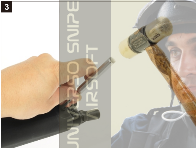
移除護木插梢。 Remove the Forearm Locking Pin.