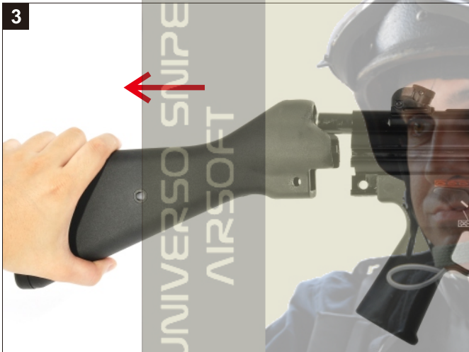
3 移除固定托。 Remove the Buttstock.