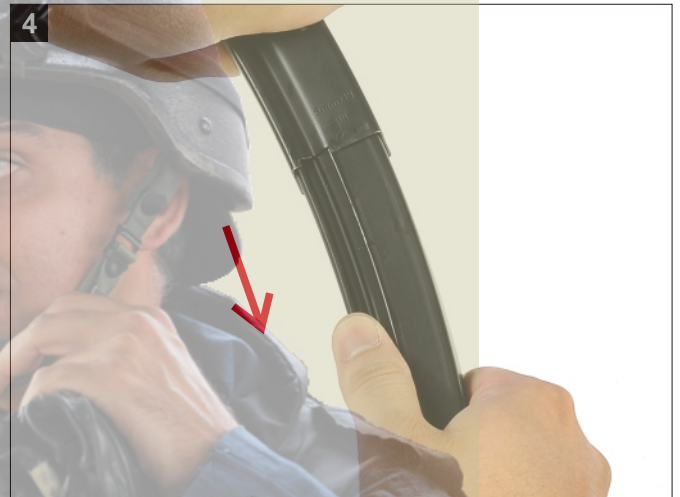
4 卸下彈匣內膽。 Remove the Magazine Inner Tank.