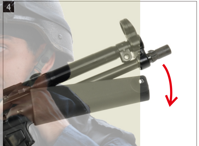
卸下護木。 Remove the Forearm.