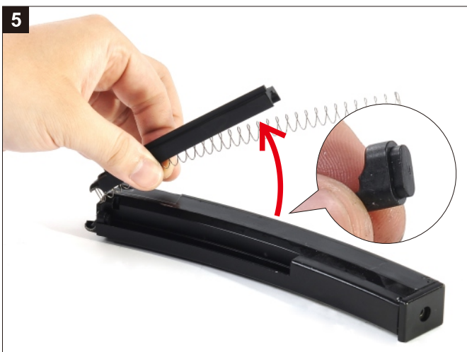
5 分解彈匣。 Remove the Magazine Follower.