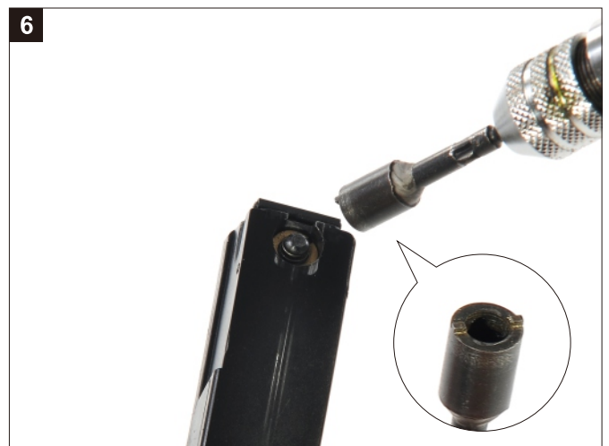
6 以專用工具將彈匣氣閥卸下，完成。 Remove the Valve by using a specific tool.