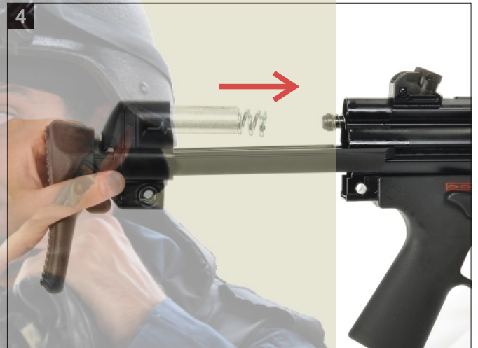
4 注意相對位置。 Make sure the retractable stock is in the right position.