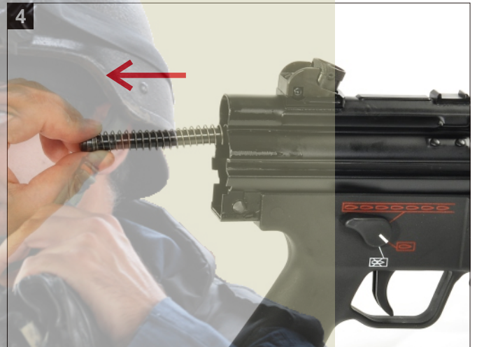
4 移除覆進簧連桿。 Remove the Recoil Spring and Guide Rod.