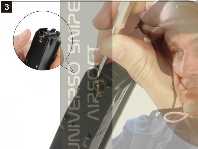
3 壓住氣閥，將彈匣內膽敲出。 Depress the Valve and tap out the Magazine Inner Tank.