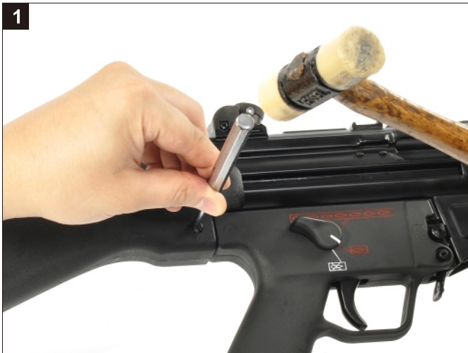
1 移除槍托插梢。 Remove the Rear Pin.