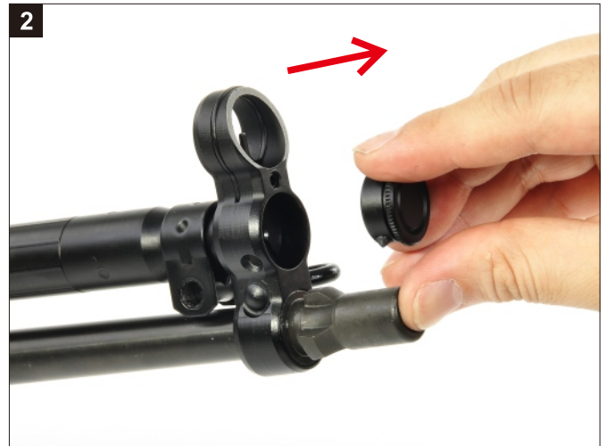
移除拉柄套筒前蓋。 Remove the Cap of the Cocking Tube.