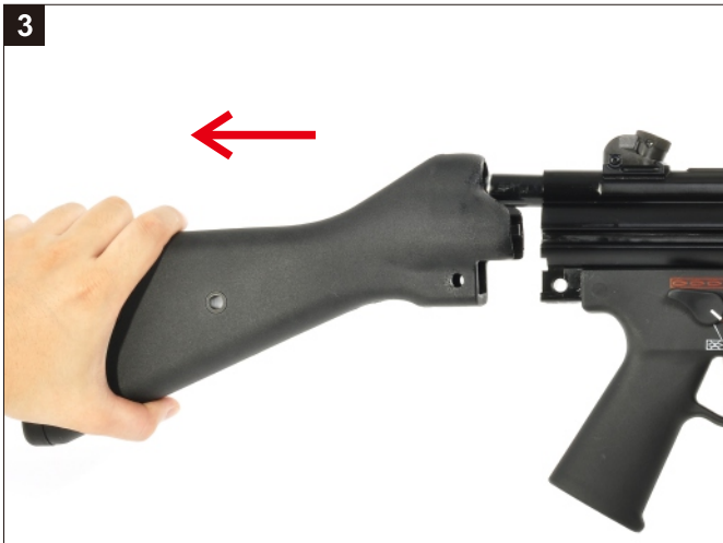
3 移除槍托。 Remove the Buttstock.