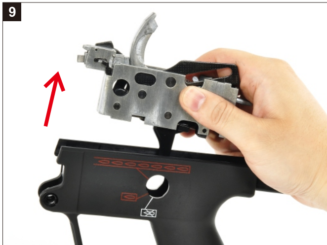
移除扳機組，完成。 Pull the Trigger Mechanism out of the Plastic Grip.