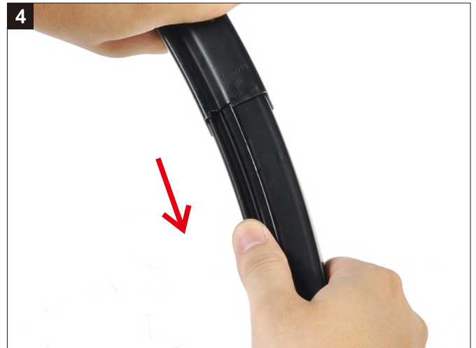
卸下彈匣內膽。 Remove the Magazine Inner Tank.