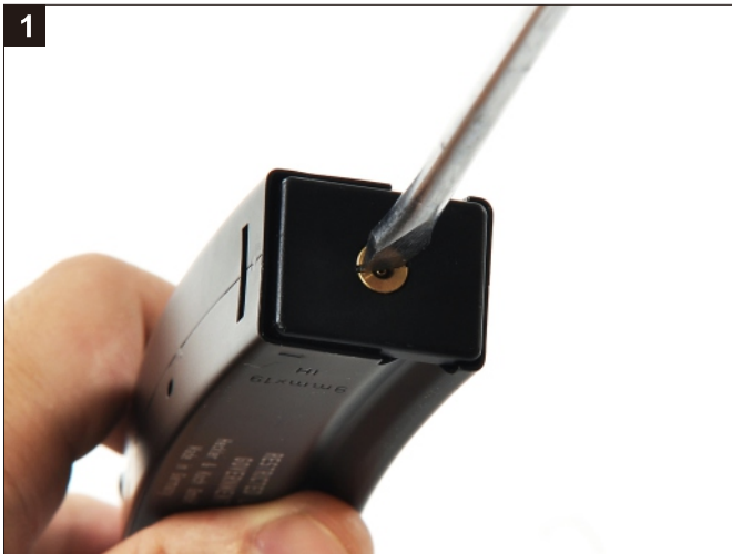
將彈匣內氣體釋出，並以工具卸下灌氣嘴。 Make sure the magazine is empty without gas before remove the Injection Valve.