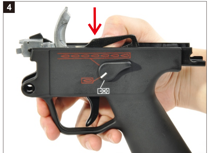
將保險抓桿下壓。 Press down the Catch Lever.