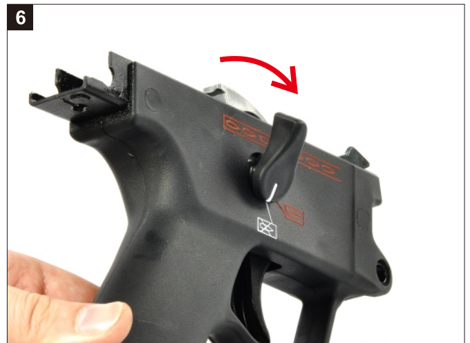
移除右側選擇鈕撥桿。 Remove the Selector Lever from the right side of the Trigger Group.