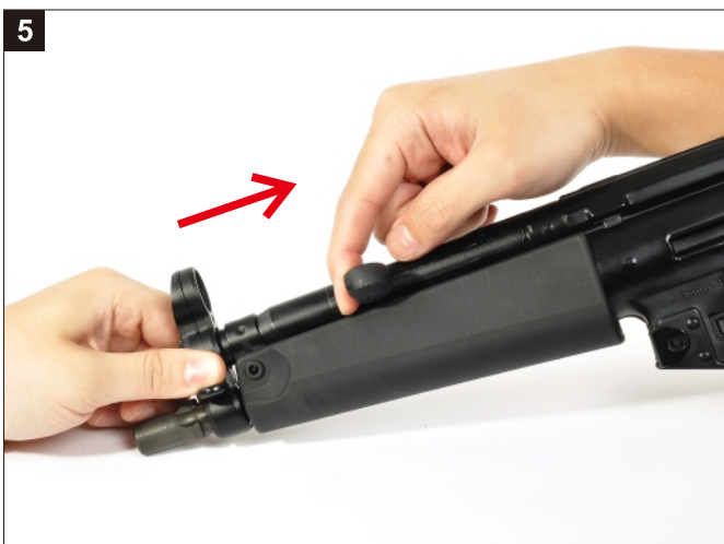
5 拉動槍機拉柄，使槍機組向後退出。 Pull the Cocking Lever rearward.