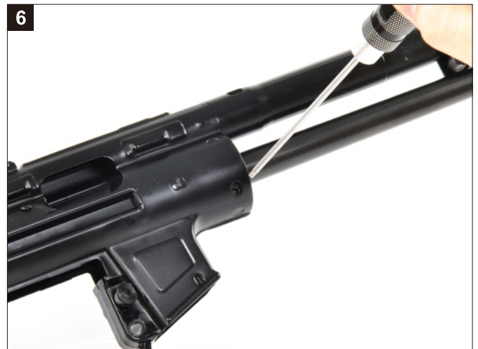
同左。 Same as left.