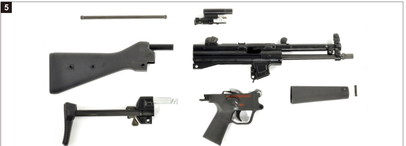
大部分解完成。 Disassemble Complete.