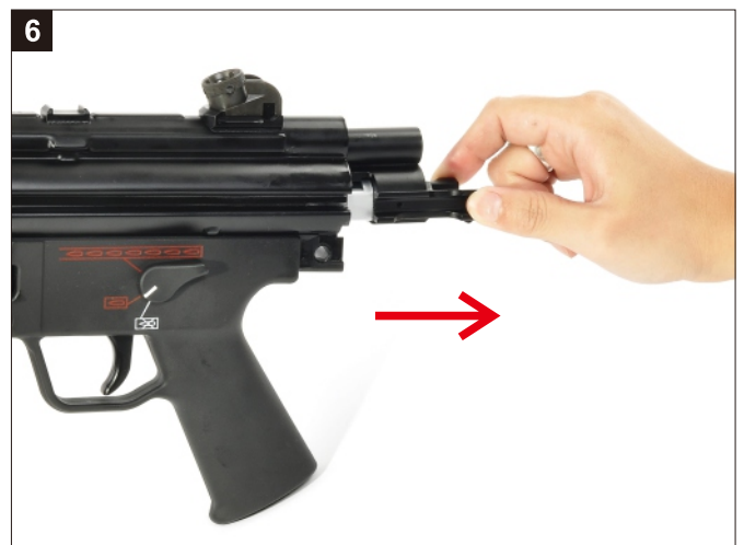
6 卸下槍機組，完成。 Remove the Bolt Carrier.