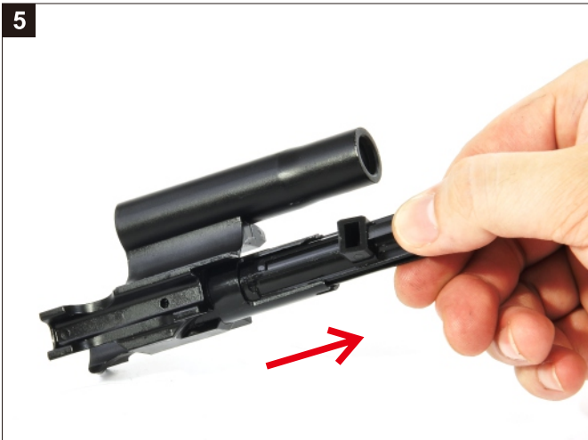
移除進彈浮動嘴。 Remove the Loading Nozzle.