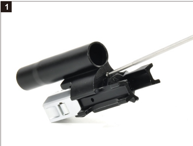
移除槍機頭固定螺絲。 Remove the screw.