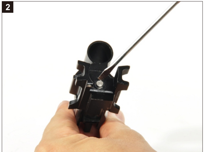
移除進彈浮動嘴固定扣(E字扣)。 Remove the E-ring nut washer.