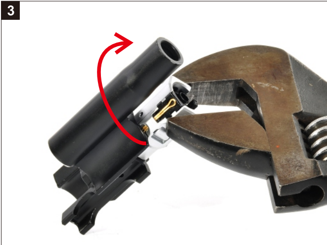
以工具將槍機頭外罩作順時針方向旋轉。 Clockwise the Bolt Head.