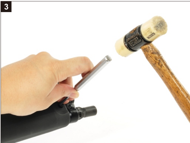
移除護木插梢。 Remove the Forearm Locking Pin.