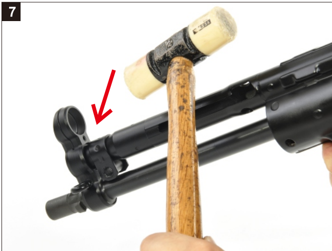
以工具敲擊準星座如圖，使槍管與槍身分離。 Remove the Barrel by tapping the Front Sight.