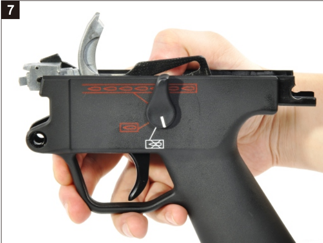
將保險抓桿下壓。 Press down the Catch Lever.