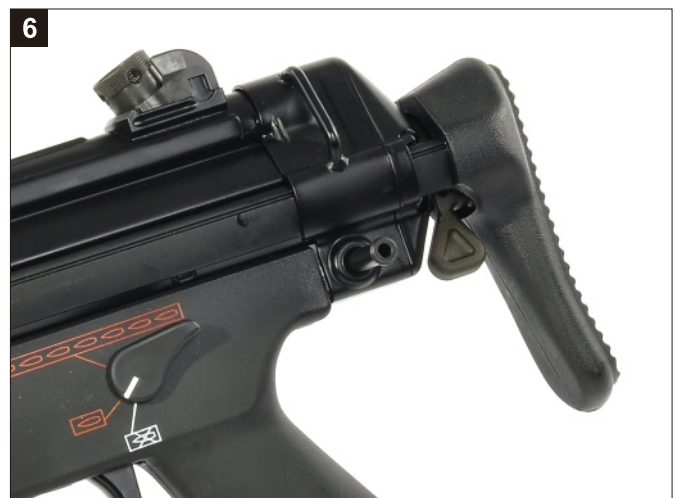
6 安裝槍托插梢，完成。 Replace the Locking Pin.