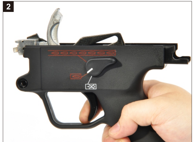
扣壓扳機釋放擊錘。 Pull the Trigger and allow the hammer to snap forward.