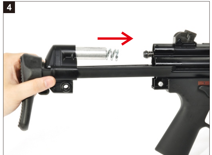
4 注意相對位置。 Make sure the retractable stock is in the right position.