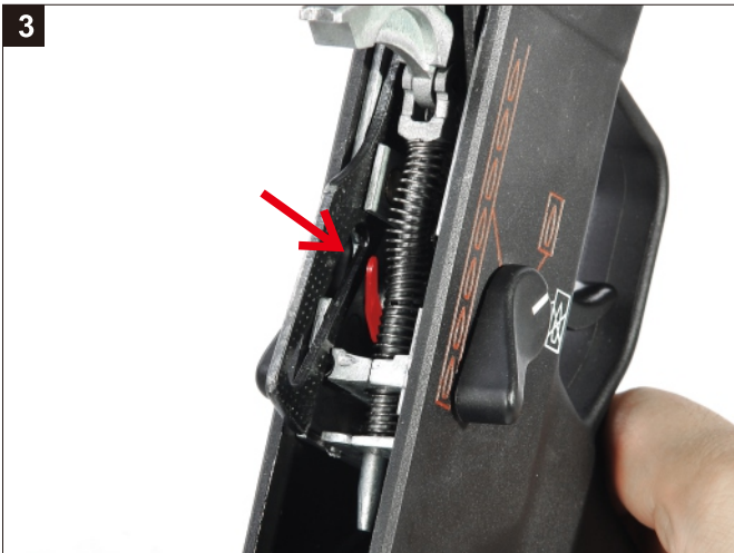
箭頭處為保險抓桿。 Catch Lever.