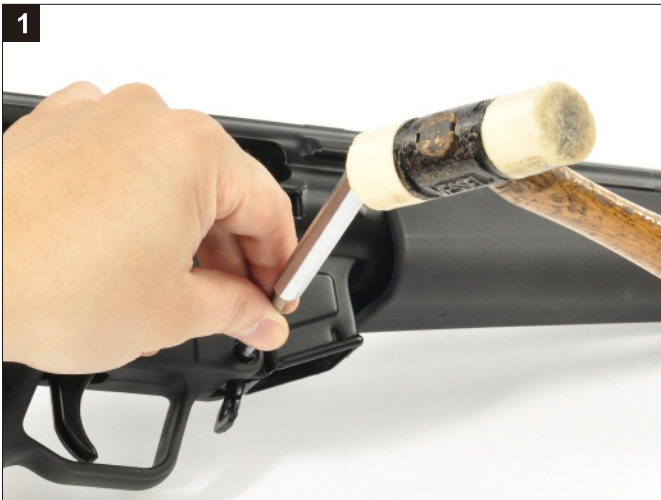
承前頁，移除槍身插梢。 Remove the Trigger Group Locking Pin.