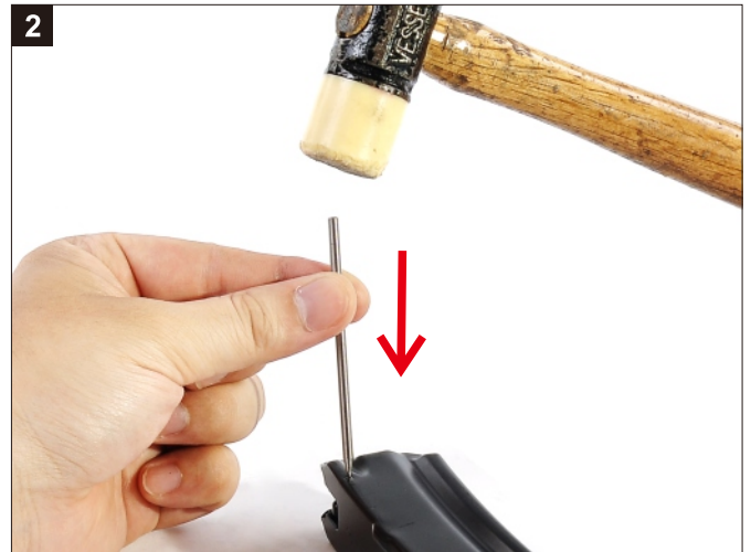
將彈匣固定梢敲出。 Remove the pin by tapping it out.