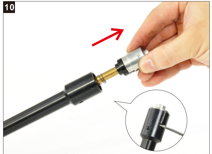
移除外槍管與Hop-Up座尾座。 Remove the Hop-Up Set form the Barrel by using a small flathead screwdriver.