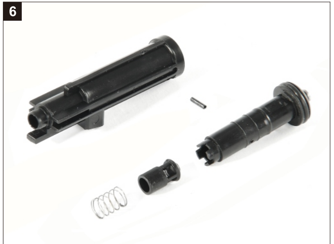
更換進彈浮動嘴零件，完成。 Replace the spare parts.