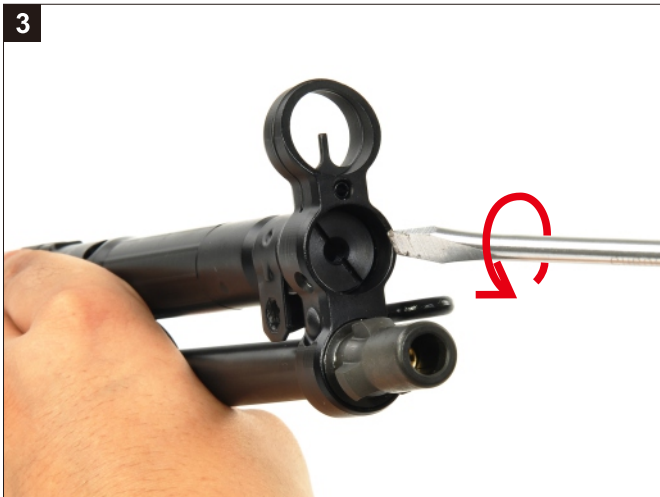
以工具將拉柄套筒螺帽逆時針方向旋出。 Anticlockwise the screw of Cocking Tube.