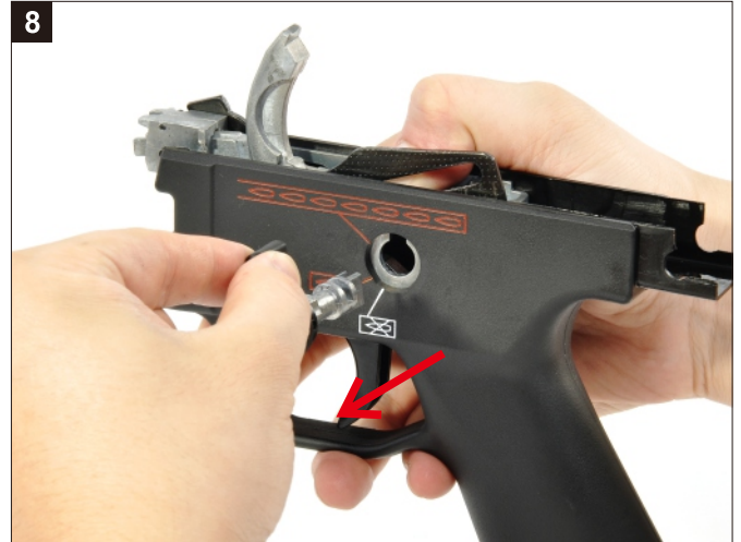
移除左側選擇鈕撥桿。 Remove the Selector out of the left side of the Trigger Group.