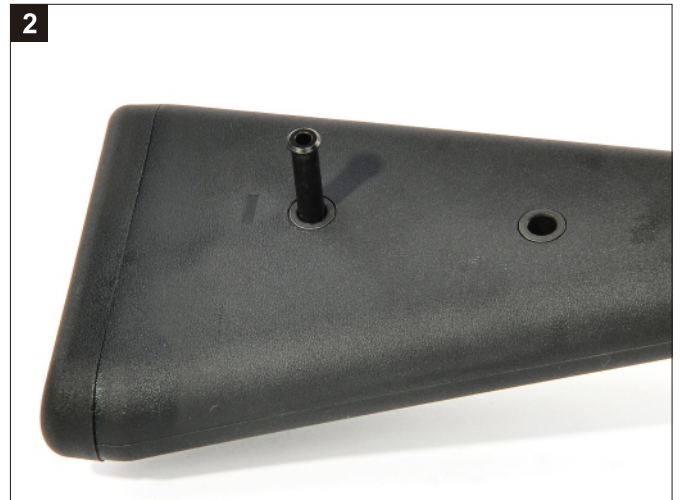
2 插梢移除後可安置在槍托上。 The pins can be stored in the Buttstock.