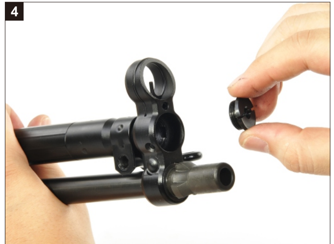
移除拉柄套筒螺帽。 Remove the screw of Cocking Tube.