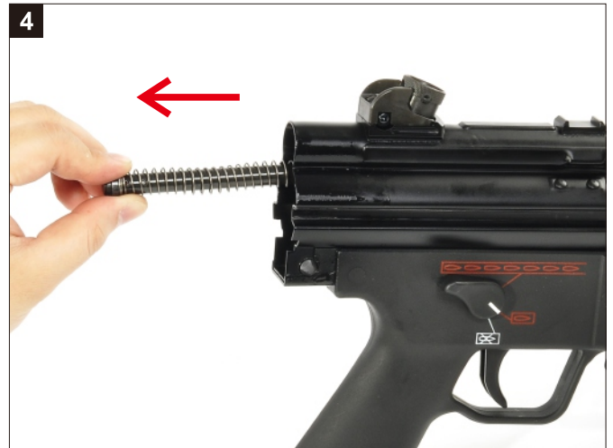
4 移除覆進簧連桿。 Remove the Recoil Spring and Guide Rod.