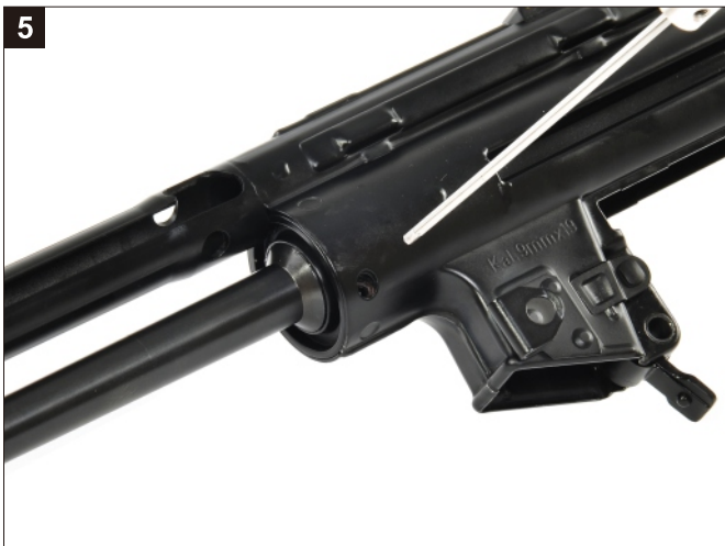
移除槍管兩側固定螺絲。 Remove the Barrel Screw.