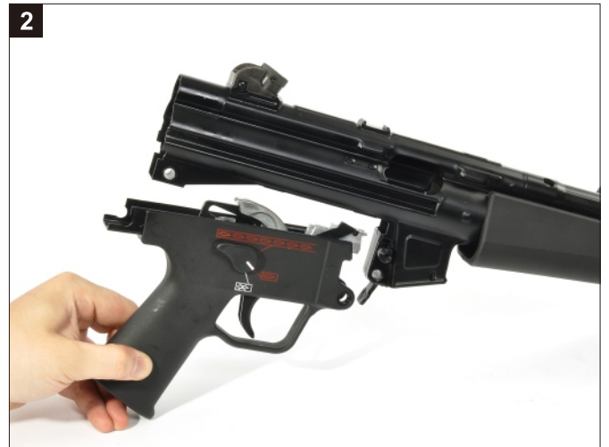
卸下扳機組。 Remove the Trigger Group.