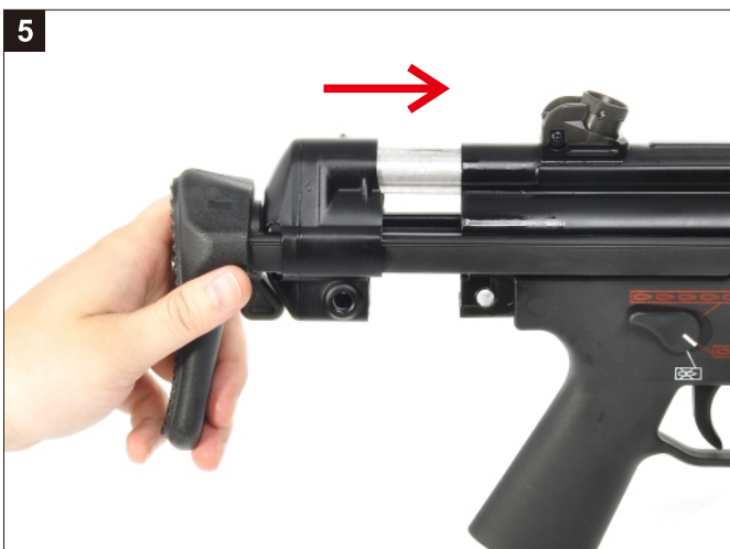
5 安裝伸縮托。 Install the Retractable Stock.