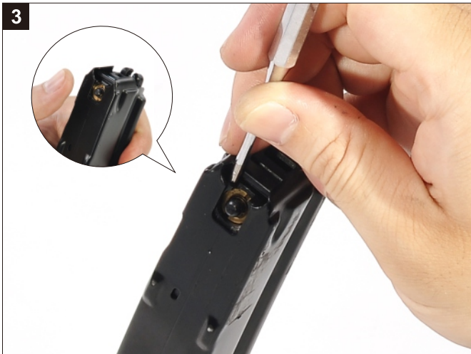
壓住氣閥，將彈匣內膽敲出。 Depress the Valve and tap out the Magazine Inner Tank.