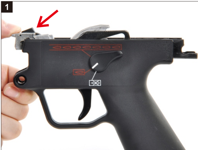
下壓箭頭處鐵片之擊錘撥桿。 Depress the Release Lever.