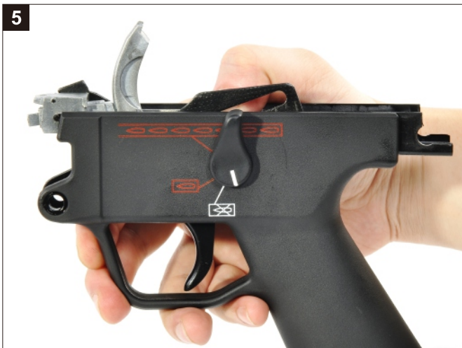
承上，將選擇鈕撥桿旋轉如圖。 Looking at the left side of the Trigger Group, rotate the Selector Lever in a clockwise turn until it stop with the white indicator line pointing down.