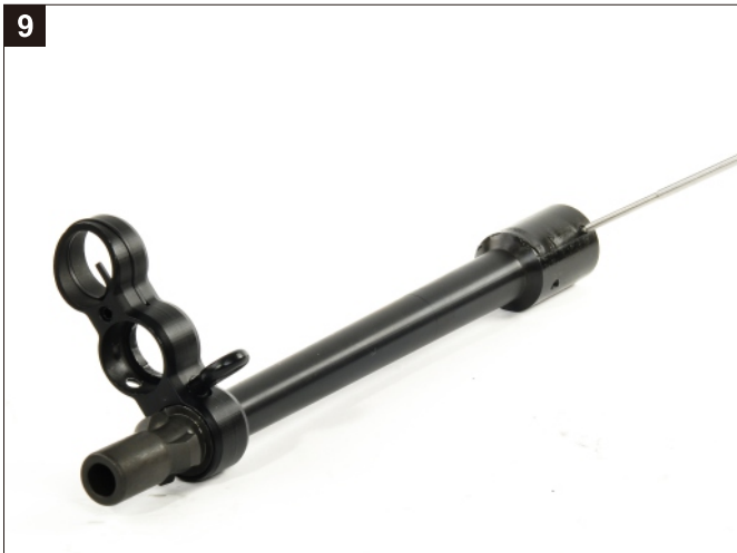
移除Hop-Up座固定螺絲。 Remove the screw of the Hop-Up Set.