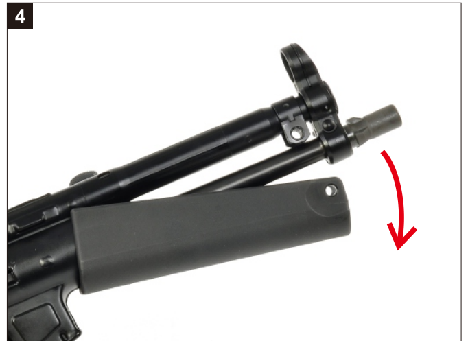
卸下護木。 Remove the Forearm.