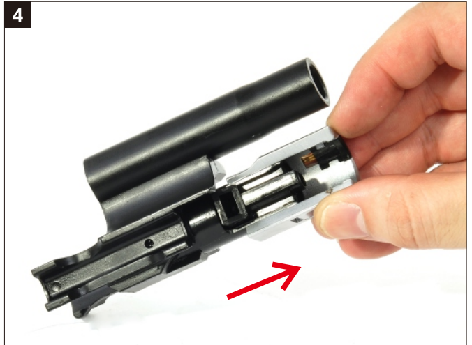
移除槍機頭外罩。 Remove the Bolt Head.