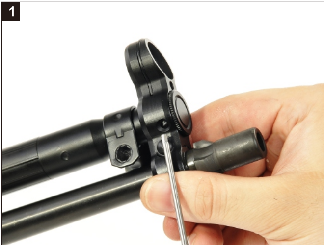
以工具將拉柄套筒前蓋頂出。 Depress the pin.